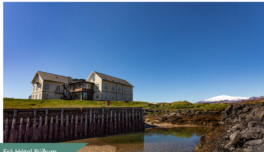
Frá Hótel Búðum

Myndin sýnir heita ölkelduvatnið í Lýsulaugum þar sem grænþörungar gera húð silkimjúka. Ölkeldur eru ein sérstaðan á Snæfellsnesi og vatnið er bráðholt til drykkjar og baða.