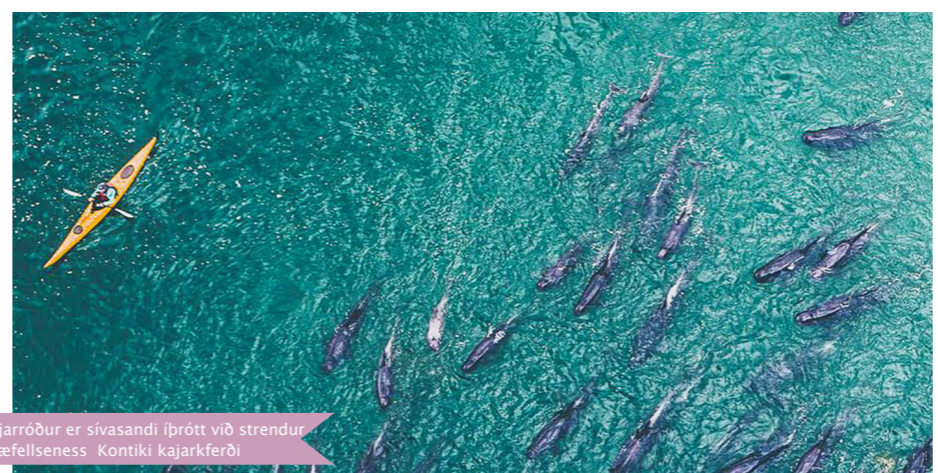
Kajarröður er sivasandi íþrótt við strendur Snæfellsnes. Kontiki kajarkferði

Áfram verður haldið í næstu viku og fólk hvatt til að nota hvert tækifæri til að fara út (muna smitvarnir, 2 metra millibil ofl.) og njóta náttúrunnar sem við erum svo heppin að hafa allt um kring.