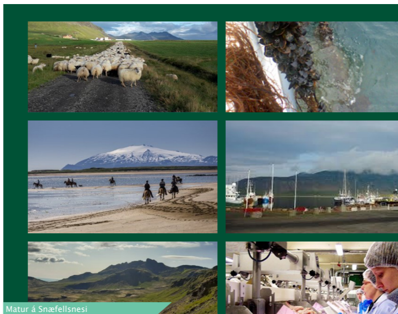
Matur á Snæfellsnesi Svæðisgarðurinn Snæfellsnes 2019

Fullskipað Fulltrúaráð Svæðisgarðsins kemur venjulega saman tvisvar á ári. Á ársfundi þess eru teknar ákvarðanir um forgangsverkefni Svæðisgarðsins og samþykkt verkefna- og fjárhagsáætlun hvers árs.