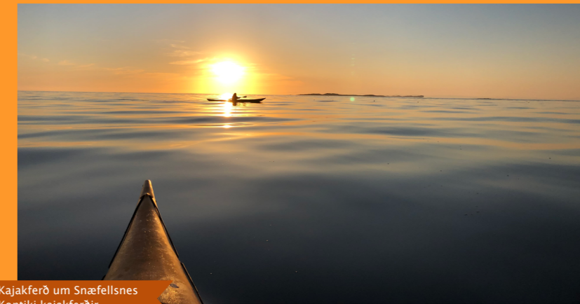
Kajakferð um Snæfellsnes Kontiki kajakferðir

Eitt lykilverkefnið framundan er því að auka sýnileika Svæðisgarðsins.