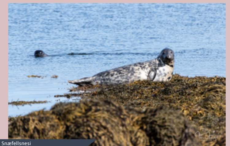
Selir á Snæfellsnesi

Íbúar á Snæfellsnesi eru hvattir til að ferðast um Snæfellsnes og njóta þeirrar náttúru og menningar sem í boði er.