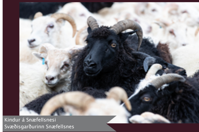
Kindur á Snæfellsnesi Svædisgarðurinn Snæfellsnes