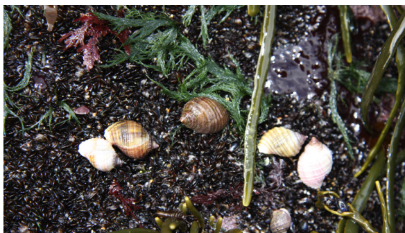
Nákuðungar gæða sér á smákrækling (Ljós. Erlingur Hauksson).

Þetta verkefni var unnið að frumkvæði Svæðisgarðsins Snæfellsness, í samstarfi við Vör sjávarrannsóknasetur, Hafrannsóknisstofnun og grunnskóla á Snæfellsnesi, með styrk frá Breiðafjarðarnefnd.