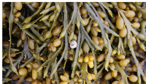
Þangdoppa á klóþangi.

Þangfjörur eru nefndar eftir stórgerðum brúnþörungum sem einkenna þær. Þangfjörur er helst að finna á skjólsömum klappar- og grjótsvæðum þar sem nóg er af föstu undirlagi fyrir þörungum til að festa sig. Oft má sjá fjörusvertu ofarlega í slíkum fjörum og meðal algengra brúnþörungum má nefna klóþang, klapparþang og bóluþang. Dýralíf í þessum fjörum er auðugt þar sem hrúðurkarlar festa sig gjarnan við undirlagið, snúðormar og þangskegg klæða sums staðar þangið og klettadoppur skriða á milli steina. Fleiri tegundir eins og marflær, þanglýs og krabba má oft finna með því að lyfta þanginu eða líta undir stein. Alltaf skal þó muna að skilja við svæðið eins og að því var komið.