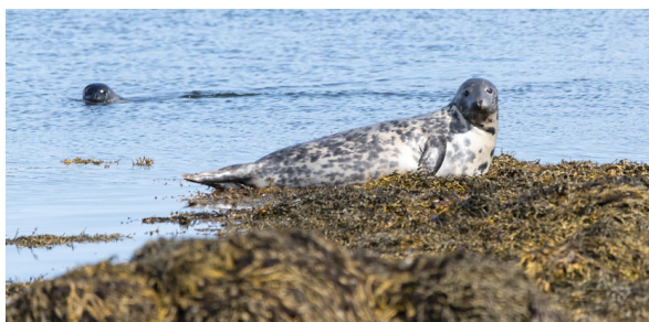
Seli má oft sjá í fjöruferðum.