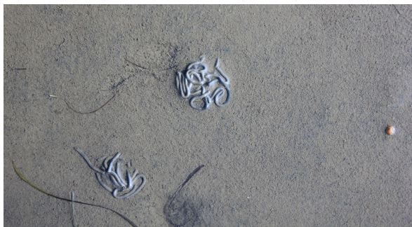
Í leirum má oft finna sandmaðk.