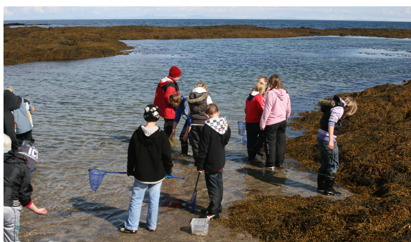
Gæta skal vel að sjávarföllum í fjöruferðum (Ljós. Jóhannes Ólafsson).