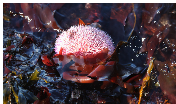
Marígull (Echinus esculentus) (Ljós. Erlingur Hauksson).

Fjöruferð krefst svolitils undirbúnings. Mikilvægt er að vera í góðum hlífðarfötum, stígvélum og vatnsheldum buxum því fjaran er blaut og víða eru pollar. Mikilvægt er að kynna sér á hvaða tíma fjaran er daginn sem ferðin skal farin og er ágætt að vera mættur um 1-2 klst fyrir háfjöru.* Það getur verið gaman að taka með sér bakka til að safna lífverum í til að skoða nánar. Einnig er nauðsynlegt að fara að öllu með gát og bera virðingu fyrir umhverfinu. Við mælum með því að hafa ávallt í heiðri lögmál fjöruhallans sem sjá má hér á eftir.