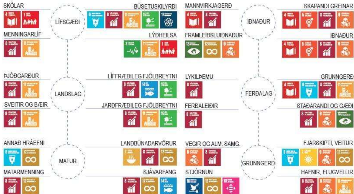
Mynd 3. Hér sést samsvörun markmiða í Svæðisskipulagi Snæfellsness 2014-2016 við Heimsmarkmið Sameinuðu þjóðanna.

Tenging við Heimsmarkmið Sameinuðu þjóðanna um sjálfbæra þróun